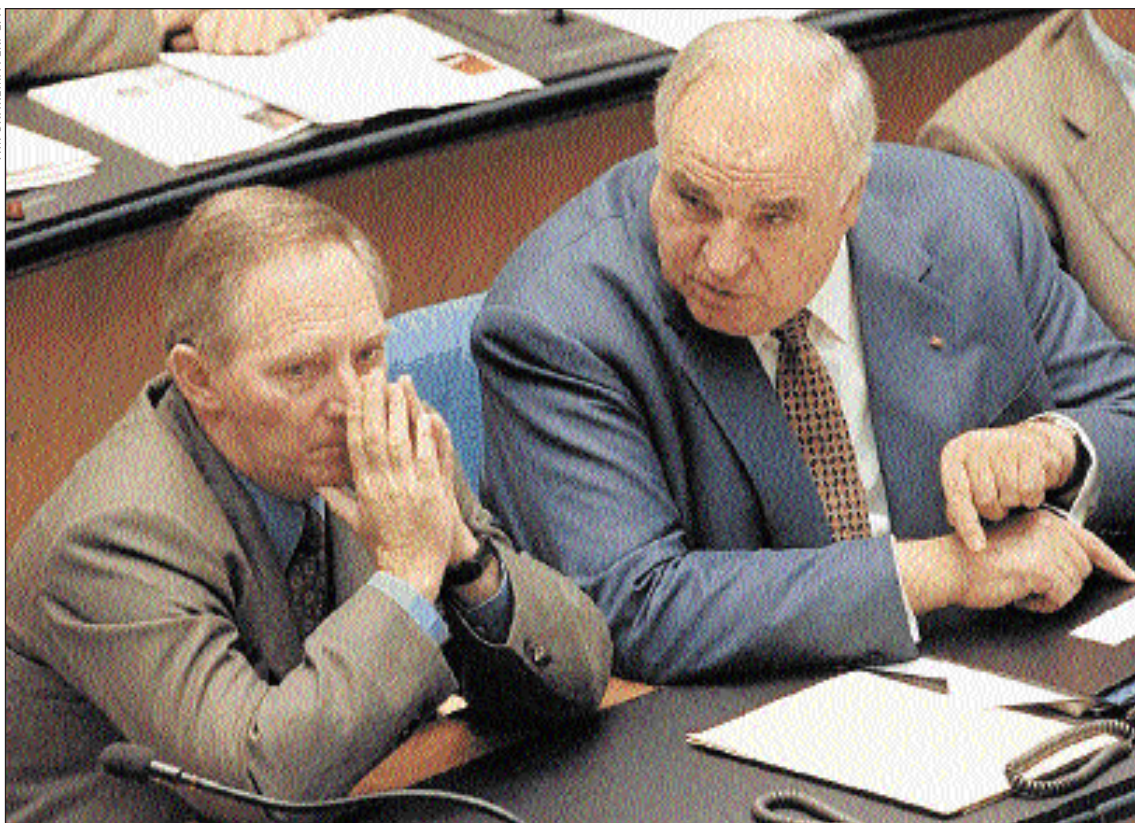
CDU:s nye partiledare Wolfgang Schäuble (till vänster) tillsammans med Helmut Kohl på en bild från 1997. Nu uppmanar Schäuble Kohl att tala om vem som ligger bakom de illegala partigåvorna till CDU.