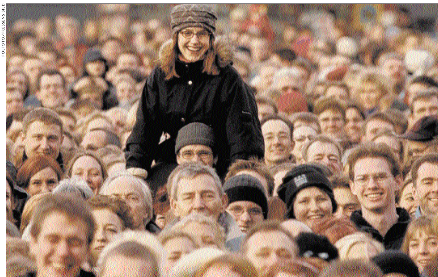
Tusentals människor samlades på Rådhuspladsen i Köpenhamn i går för att sätta världsrekord i skritt på världsskrattdagen.

Tankarna uppmuntras av den svenska regeringen, som gärna vill se en fast förbindelse. Enligt statsminister Göran Persson skulle förbindelsen både knyta länderna i regionen närmare samman och överbrygga den sista tidsödande överfarten till kontinenten.